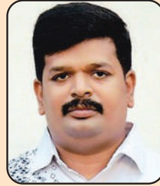
അരണാട്ടുകര ശ്രീ. അനൂപ് രേവീസ് കാട