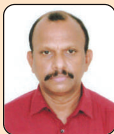
ശ്രീ. ലാൻസ്ഡേറ്റ് സാമുവൽ ജോയിന്റ് കോർപ്പറേഷൻ സെക്രട്ടറി